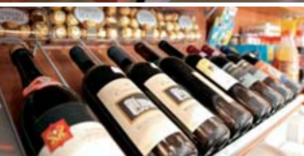
Enoteca Wine shop