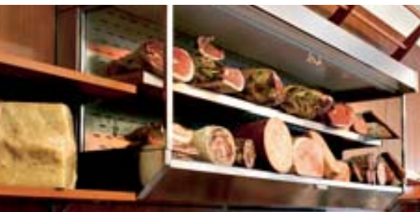
Alimentari salumeria Delicatessen