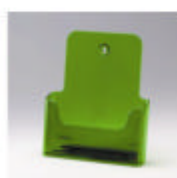
ral 0500 neongroen