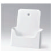
ral 9010 zulverwit