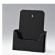
ral 9011 grafisch zwart