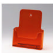
ral 0100 neonoranje