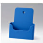
ral 5005 signaalblauw