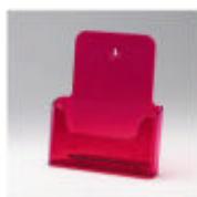
ral 0200 neonrood