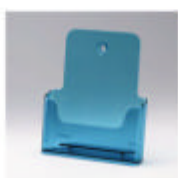
ral 0300 neonblauw