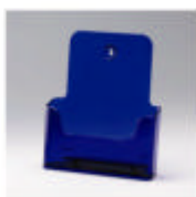
ral 0400 neonpaars