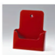
ral 3001 signaalrood