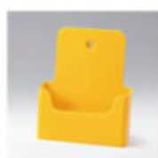
ral 1003 signaalgeel

Naast de glasheldere uitvoering is het gehele assortiment ook in diverse kleuren verkrijgbaar :