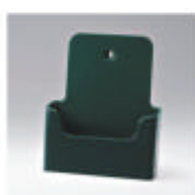
ral 6005 mosgroen