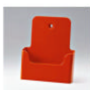
ral 2004 zulveroranje