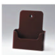
ral 3004 purperrood